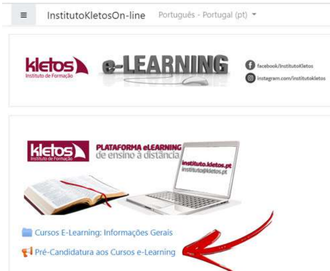
Fig. 2 Como se candidatar aos cursos

As candidaturas só ficam válidas, com o envio, por email, pelo candidato, do comprovativo do donativo do curso, o qual nos ajuda a manter a plataforma a funcionar.